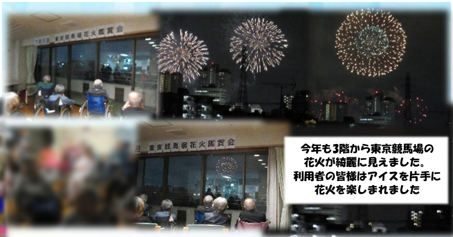
今年も3階から東京競馬場の花火が綺麗に見えました。利用者の皆様はアイスを手片手に花火を楽しみました